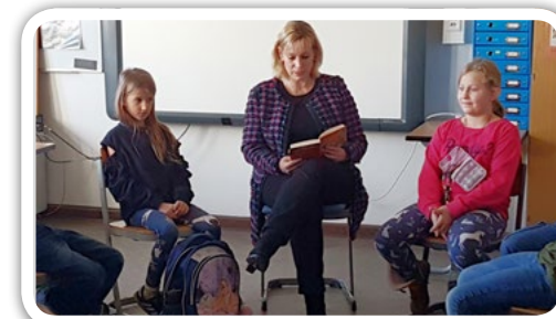
Bildungsstadträtin Katrin Schultze-Berndt beim Vorlesetag in der Grundschule am Vierrutenberg.

Der Bundesweite Vorlesetag ist eine gute Gelegenheit, die enorme Bedeutung des Vorlesens herauszustreichen. Kindern, denen vorgelesen wird, haben es leichter, lesen zu lernen und sie verfügen über einen größeren